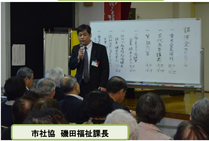
市社協 磯田福祉課長