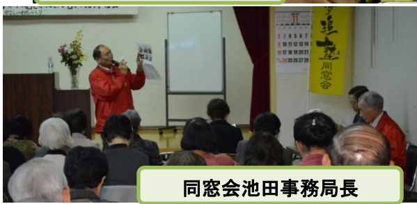
同窓会池田事務局長