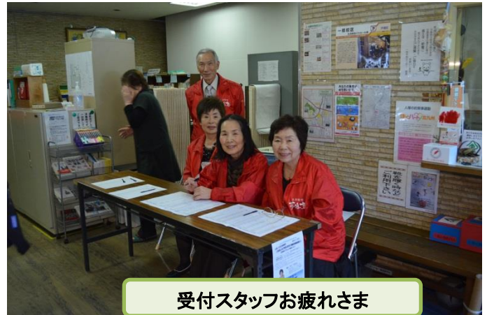
受付スタッフお疲れさま