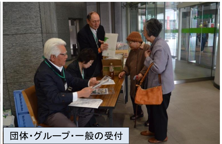
団体・グループ・一般の受付