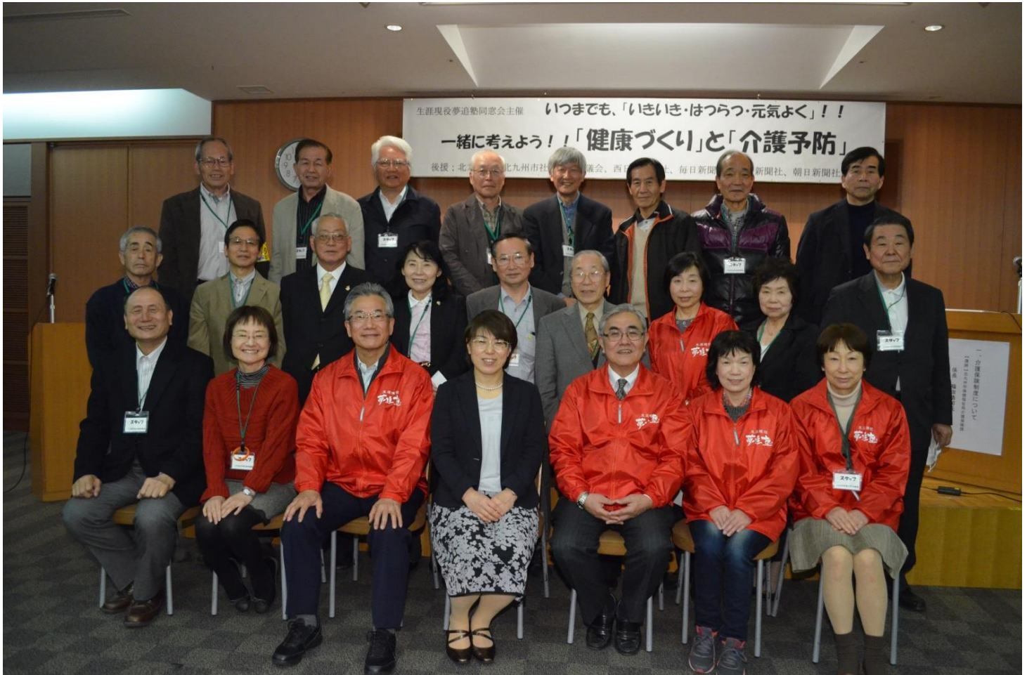
古野講師と実行委員一同による記念撮影