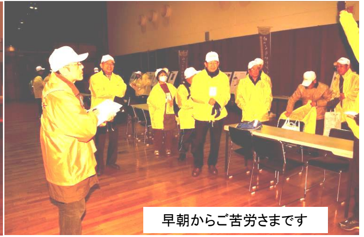
早朝からご苦労さまです