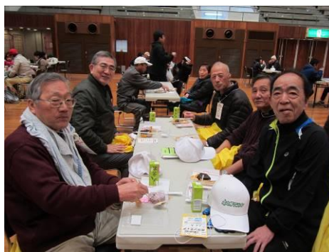
ジャンパーを脱いでしばし休憩