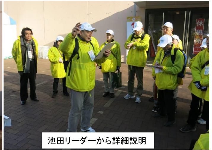
池田リーダーから詳細説明