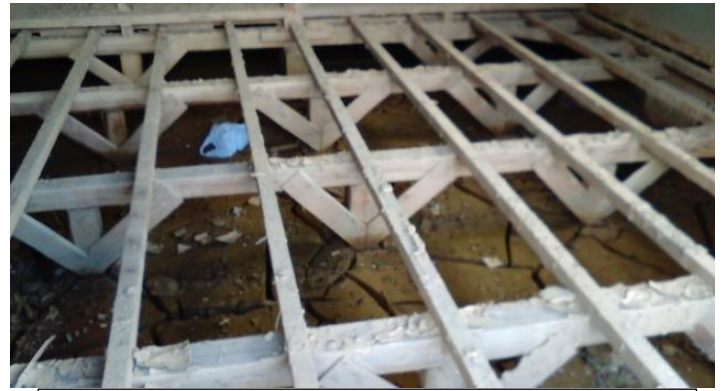
床下の土砂は乾燥すると固くなり掻き出すのが困難に