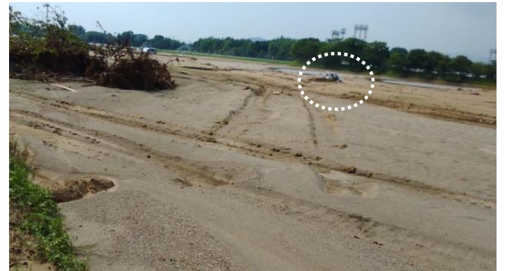
土砂で埋まった田んぼに軽トラが1台