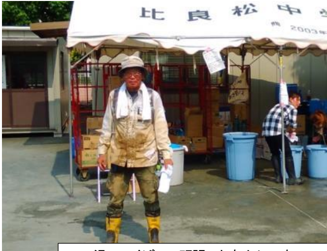
這いつくばって頑張ったあかしです