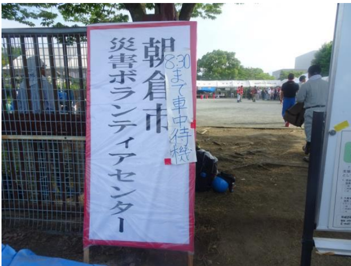
朝倉球場に開設されたボランティアセンター(今は別場所)