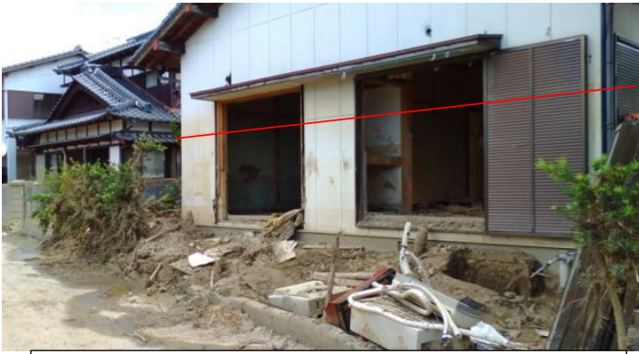
浸水の跡がくっきり残る依頼者宅(赤線部)