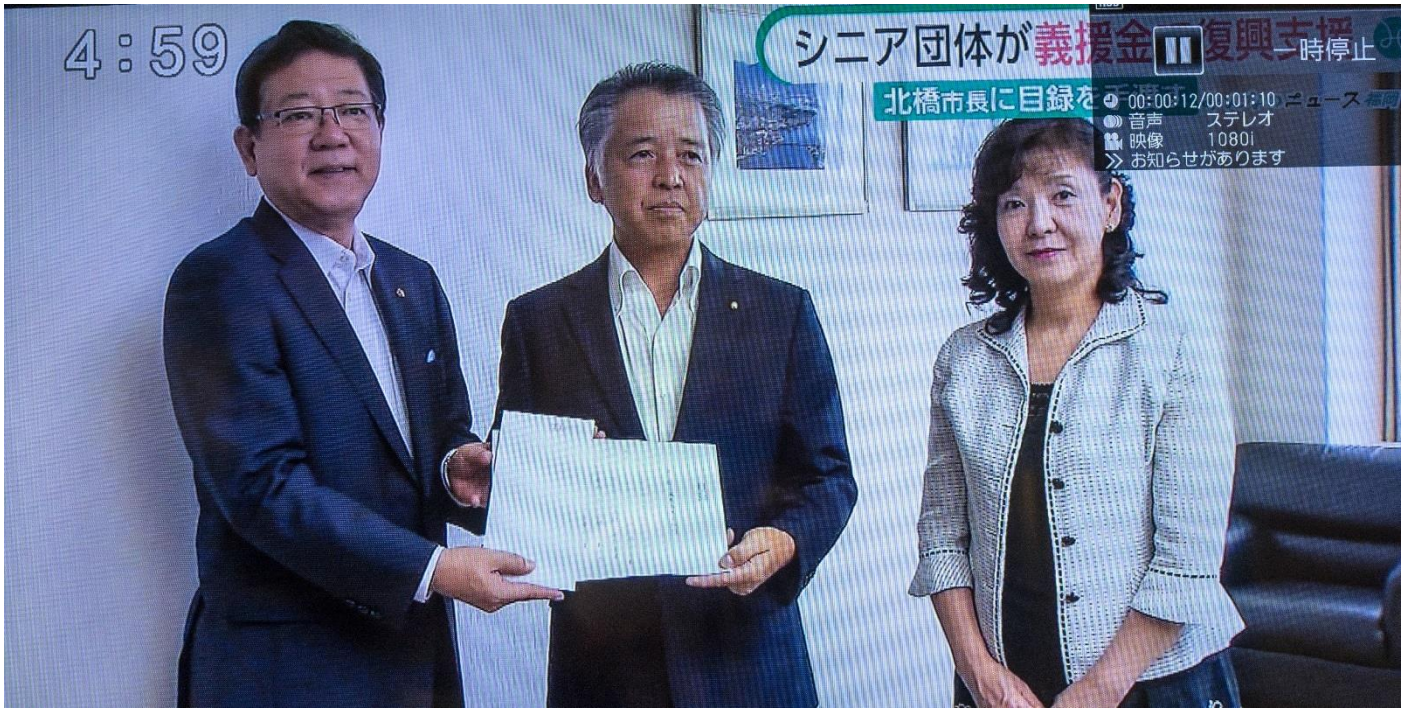
夢コンでの募金約12万円を九州北部豪雨義援金として、市長に預託しました。