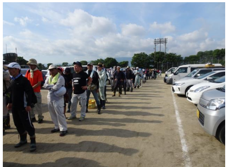
炎天下で行列して受付を待つ多数のボランティア